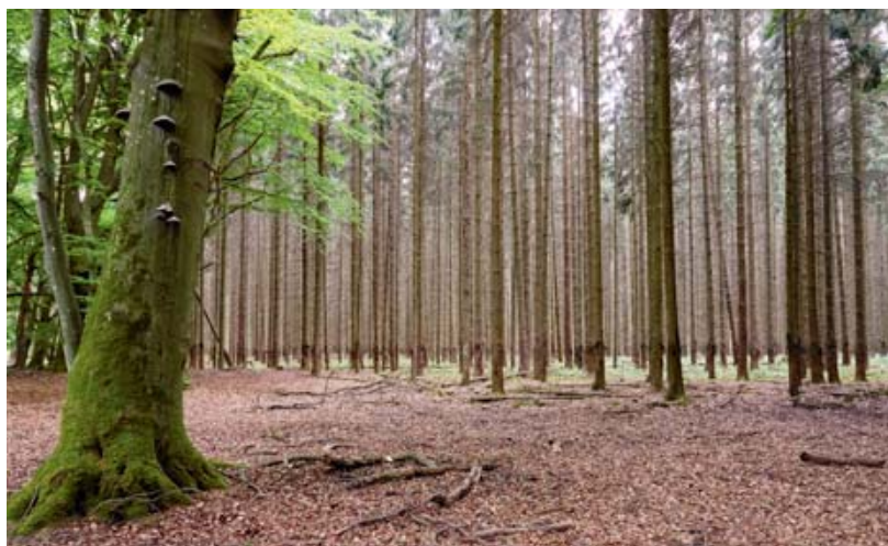
Reine Fichtenwälder sind durch Sturmschäden und Borkenkäfer viel stärker gefährdet als Misch- oder Laubwälder.

Die Fichte ist aber im Rückzug. Sie wird in den nächsten Jahrzehnten in den Zürcher Wäldern seltener werden und zum Teil sogar verschwinden. «Die Baumart, welche ursprünglich in den Bergwäldern angesiedelt ist, besitzt flache Wurzeln, und dadurch gelangt sie in trockenen Phasen nicht an das notwendige Wasser», erklärt Daniel Dahmen. Dies ist vor allem in den zunehmend trockeneren Sommermonaten ein Problem. Durch den Wassermangel wird der Baum geschwächt und dadurch anfälliger für den Käferbefall und Sturmsituationen.