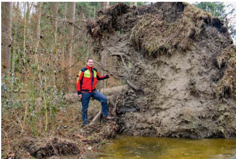
Orkanereignisse können mit zunehmendem Klimawandel häufiger die geschwächten oder gestressten Bäume entwurzeln.

Der Wald liegt grossen Teilen der Bevölkerung nicht nur räumlich nahe, sondern auch emotional am Herzen. Warum aber ist Wald nicht nur als Lebensraum für die darin lebenden Tiere und Pflanzen von grösster Bedeutung, sondern auch für die Menschen? Der Kanton Zürich wird immer städtischer – der Wald zunehmend wichtig als Erholungsraum. Grünräume wie die siedlungsnahen Wälder sind für die Lebensqualität entscheidend. Als Wasserspeicher dämpfen die Wälder ausserdem die Hochwassergefahr und unterstützen die Trinkwasserversorgung. Wald liefert Holz als Werkstoff und Energielieferant und dient als längerfristige Senke für das Klimagas CO 2 .