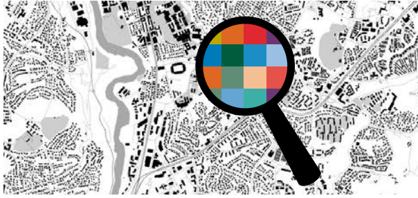
Im ersten Schritt werden alle Interessen erhoben ...