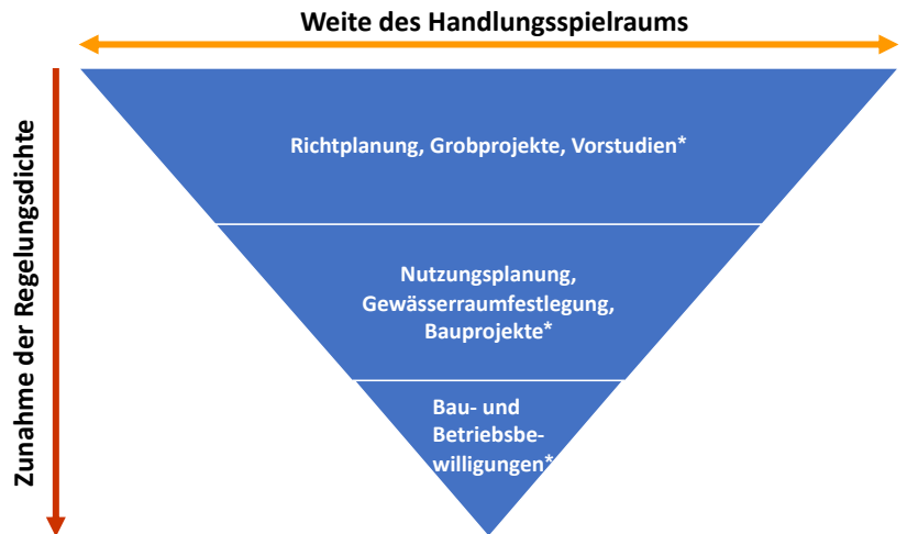
Verfahrensspezifische Handlungsspielräume für die Abwägung. *Bei den genannten Beispielen bestehen in der Tendenz mehr oder weniger grosse Handlungsspielräume. Die Weite des Handlungsspielraums muss aber im Einzelfall geklärt werden.

Räumliche Veränderungen haben Auswirkungen auf die Menschen und ihre Umwelt. Je mehr Interessen dabei aufeinandertreffen, umso grösser ist die Wahrscheinlichkeit, dass nicht alle Interessen wie erhofft oder erwünscht verwirklicht werden können. Die Änderung eines Nutzungsplans, die bauliche Verdichtung eines Ortsteils, die Umgestaltung einer Strasse oder die Errichtung einer Deponie sind typische Beispiele, die regelmässig eine Abwägung zwischen verschiedenen Interessen benötigen.