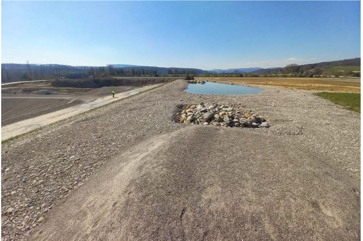
Als Ersatzwanderbiotope wurden in den angrenzenden Kiesgruben unter anderem Weiher und Steinhaufen angelegt.

kiesige Flächen vorgesehen – solche naturnahen Untergründe werden von Tieren besser angenommen als Beton oder Asphalt. Auf einer Seite werden zudem Baumstämme angeordnet, die besonders Kleinsäugetern Versteckmöglichkeiten bieten. Zudem gibt es zwei Fledermauskästen. Fledermäuse überdauern den Tag unter anderem in Baumhöhlen oder Spalten und Hohlräumen von Infrastrukturbauten wie Brücken. Fledermauskästen, wie sie bei der Unterführung geplant sind, bieten ihnen weitere Quartiermöglichkeiten.