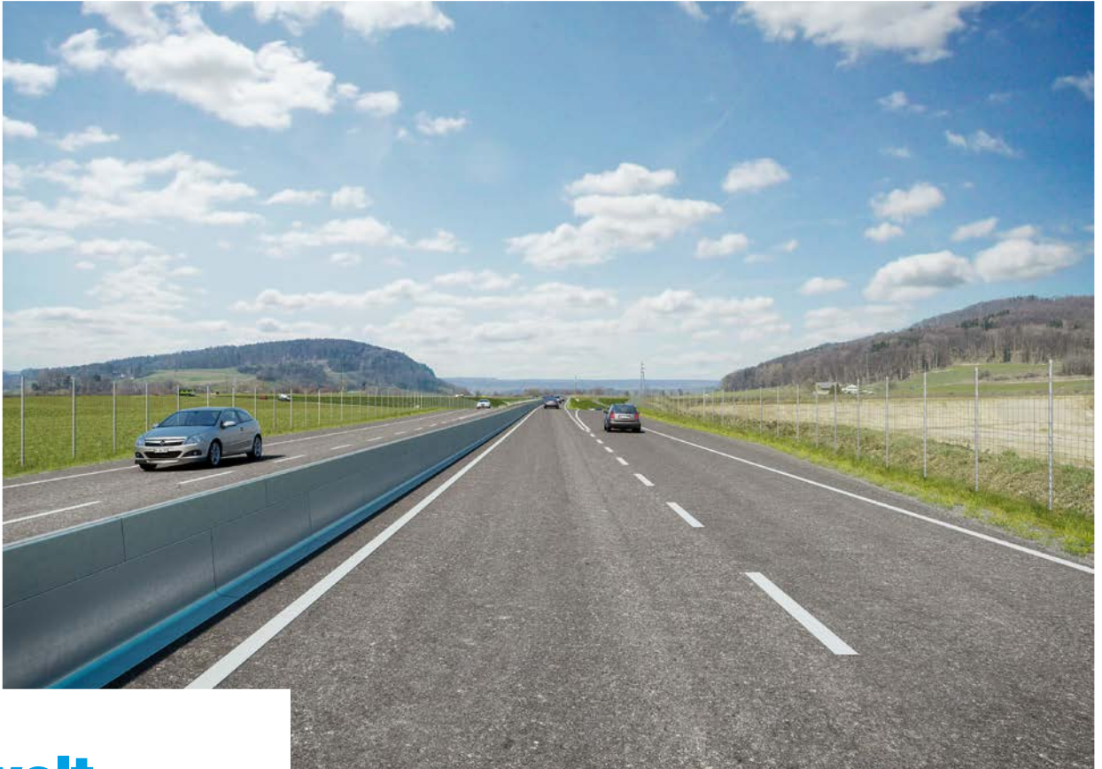
Die Schaffhauserstrasse in Bülach wird zu einer vierspurigen Miniautobahn ausgebaut.