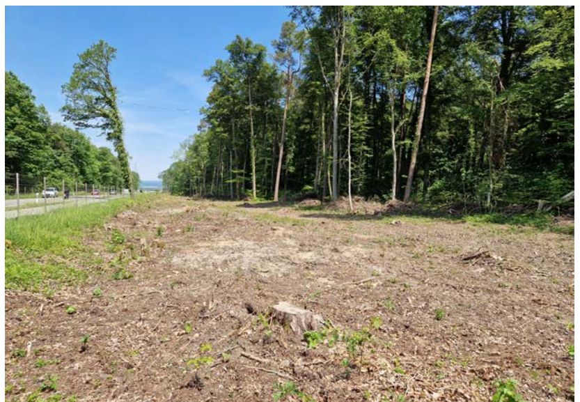
Bei der Rodung wurden einzelne Bäume (links im Bild) vorübergehend für Fledermäuse beziehungsweise für deren bessere Orientierung stehen gelassen.

oder unterfliegen. Die Hecken und Büsche dienen auch ihnen als Leitstrukturen. Zudem wird bei diesen Über- und Unterführungen ein Blendschutz angebracht, der dafür sorgt, dass Fledermäuse und andere Tiere nicht vom Licht der vorbeifahrenden Fahrzeuge – je nach Art – angezogen oder verschreckt werden. Und: Speziell für Fledermäuse gibt es noch