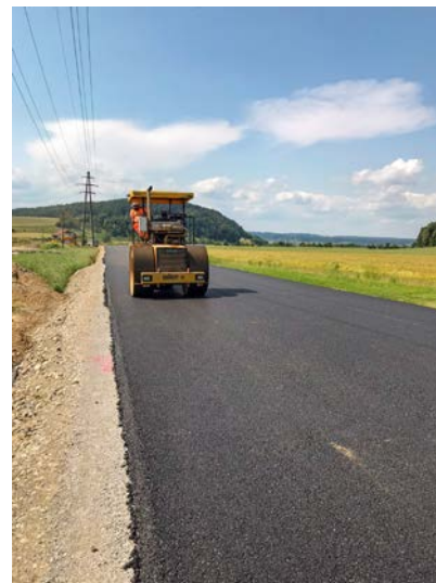
Damit der Verkehr weiterhin fließen kann, musste eine temporäre Strasse erstellt werden. Nach dem Rückbau steht die Fläche wieder der Landwirtschaft zur Verfügung.

Der Ausbau der Schaffhauserstrasse selbst bringt auch Verbesserungen im Umweltbereich mit sich. So wird unter anderem die Strassenentwässerung den