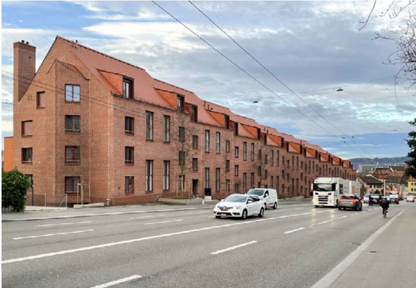
Studentenwohnheim an der lärmigen Rosengartenstrasse in Zürich.