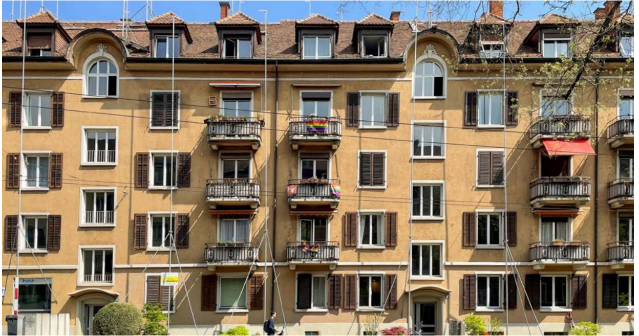
Kornhausstrasse in Zürich. Seit längerem zeigen die Visiere an, dass hier etwas geplant ist. Noch sind einige Fragen hinsichtlich Lärmoptimierung offen, und das Projekt ist vorerst sistiert.

Übrigens: Eine schöne Aussicht oder gute Besonnung können nicht als überwiegende Interessen geltend gemacht werden. Hier fällt der Lärm- und Gesundheitsschutz klar höher ins Gewicht.