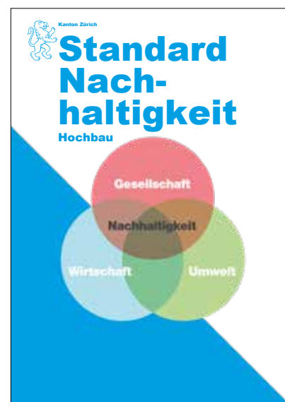
Standard Nachhaltigkeit Hochbau, Version 2.0 vom 2. Juni 2021.

Grundsätzlich können sich auch andere an unserem Standard orientieren. Es gibt aber ein paar generelle Punkte zu beachten. Zunächst sollte man nur so viel bauen wie nötig. Dies bedeutet, dass wenn immer möglich und sinnvoll das Bauen im Bestand einem Neubau vorgezogen wird. Weiter sollten ökologische Baumaterialien, wie beispielsweise Holz, eingesetzt werden, um die Graue Energie gering zu halten. Ebenso ist der Einsatz von erneuerbaren Energien wichtig. Und schliesslich ist es empfehlenswert, sich an den bekannten Labels zu orientieren und die entsprechenden Zertifikate bei den Auftragnehmern einzufordern.