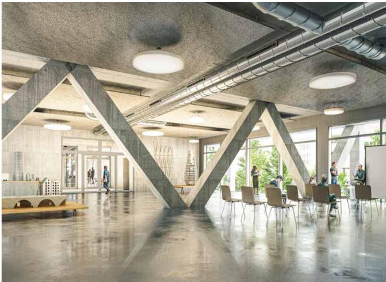
Mithilfe geschosshoher Obergurte (Träger) im ersten Obergeschoss kann die Menge an Grauer Energie minimiert werden. Die statischen Massnahmen werden dabei erlebbar in das Gebäude integriert. Quelle: Gunz & Künzle Architekt*innen, Zürich, Visualisierung: Filippo Bolognese Images, Milan

3 Millionen Franken nach Minergie-P-Eco oder Minergie-A-Eco bei Neubauten und bei Umbauten nach Minergie-Eco zertifiziert werden müssen. Bildungs-, Verwaltungs- und Wohnbauten ab einer Projektgrösse von rund 20 Millionen Franken werden ergänzend nach SNBS zertifiziert, wobei Neubauten mindestens die Stufe Gold und Umbauten mindestens die Stufe Silber erreichen müssen. Diese Zertifizierung dient uns als Qualitätssicherung.