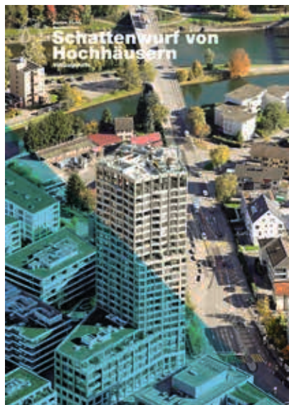
Die Vollzugshilfe «Schattenwurf von Hochhäusern» erläutert alles Wichtige zum Vollzug der Regelung.