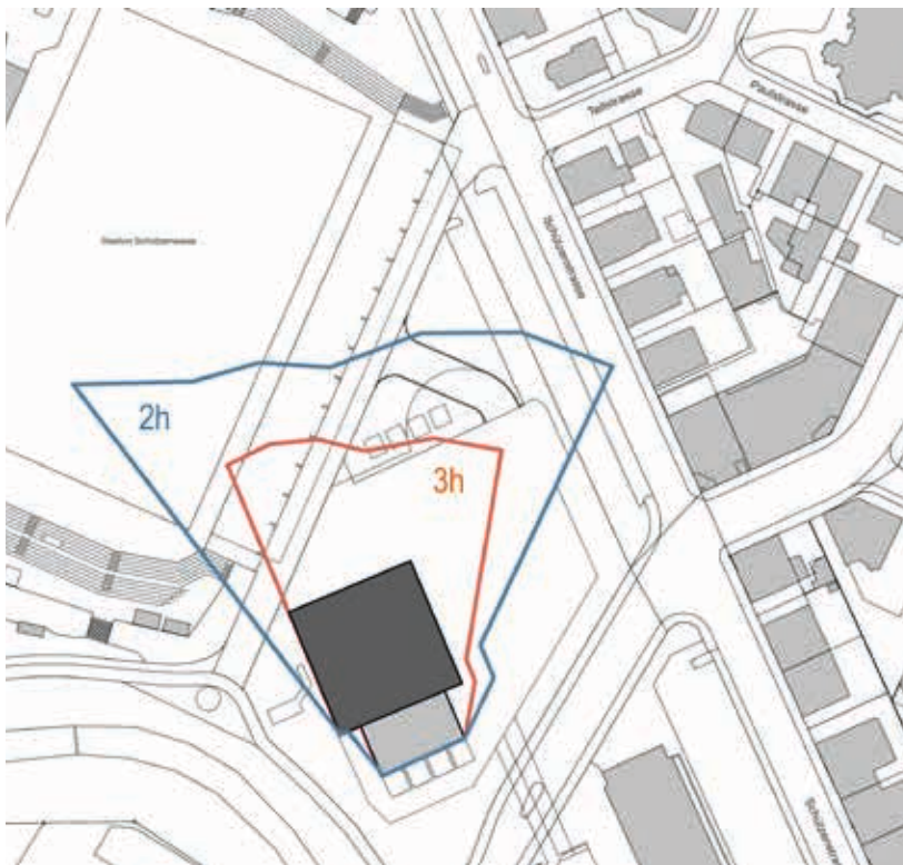
Ob naheliegende Wohngebäude übermässig beschattet werden, wird im Schattendiagramm sichtbar, und die Beschattungsdauer kann berechnet werden. Im Bild dargestellt ist der relevante Schatten bei unterschiedlicher Schattenwurfdauer (2h- bzw. 3h-Regel).

Das Hochhaus als Bauform kann so seine Qualitäten besser entfalten. Im Fokus stehen dabei zentrale Lagen, an denen eine vertikale Akzentuierung erwünscht ist. Die Gemeinden haben wie bislang die Möglichkeit, für Hochhäuser eine Gestaltungsplanung zu verlangen oder spezielle Hochhausgebiete festzulegen.