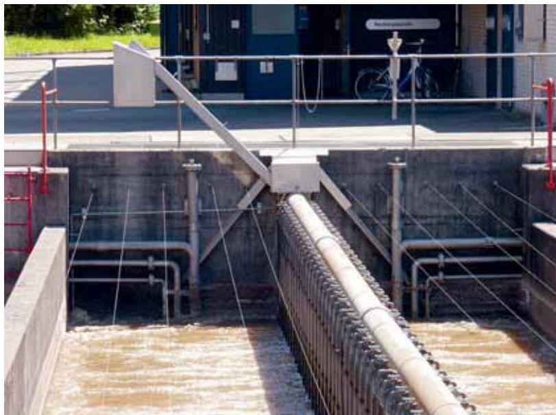
Die Tiere klettern die Rampe hinauf und warten in den Behältern, bis sie eingesammelt und anschliessend wieder ausgesetzt werden.

Alfred Hofmann Klärwerk Werdhölzli ERZ Entsorgung + Recycling Zürich Stadt Zürich Bändlistrasse 108, 8064 Zürich Telefon 044 645 54 37 alfred.hofmann@zuerich.ch