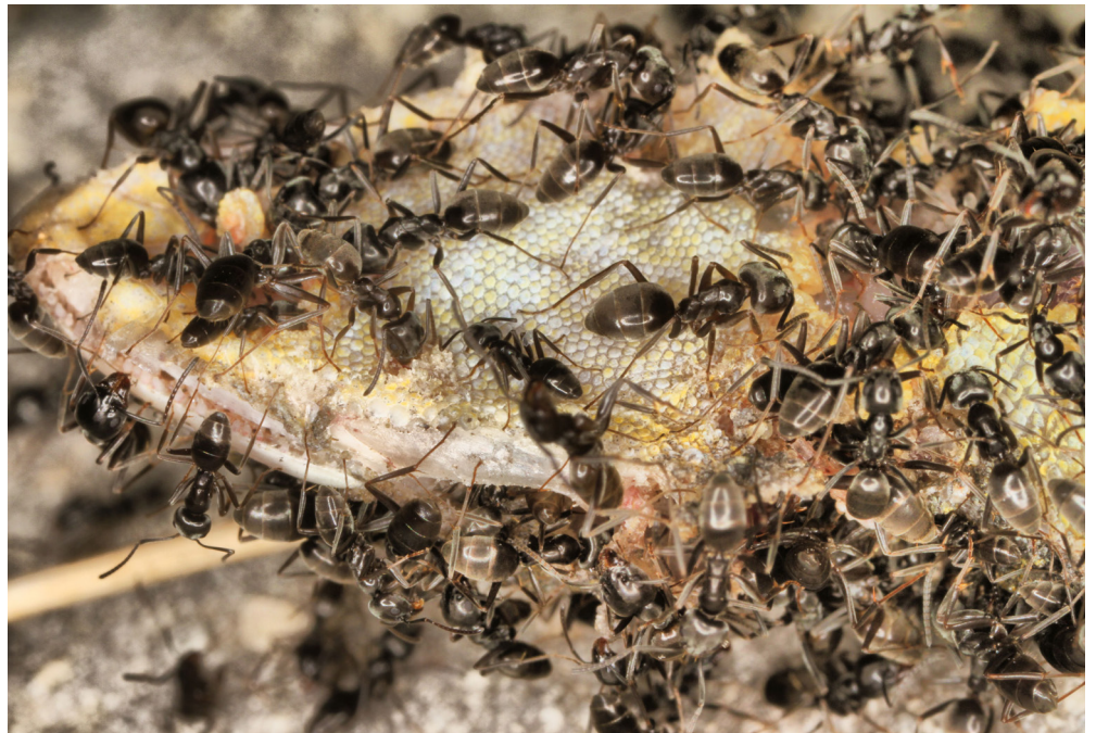
Invasive Ameisen können bei Bauarbeiten verschleppt werden. Einmal etablierte Bestände sind sehr schwer zu bekämpfen (im Bild Tapinoma magnum ).

Bei beiden Arten fliegen die Königinnen nicht aus, sondern wandern aus der bestehenden Kolonie ab. Dadurch verbreiten sie sich wesentlich langsamer als ihre geflügelten Artgenossen. Der Hauptverschleppungsweg ist mittels Topf- und Gartenpflanzen oder Erdmaterial, das vom Menschen verschoben wird. Daher ist es auch so wichtig, bei Abtransport und Entsorgung von Material aus Befallsgebieten besonders vorsichtig zu sein. Es reicht eine unentdeckte befruchtete Königin, um diese Ameisen in ein neues Gebiet zu verschleppen.