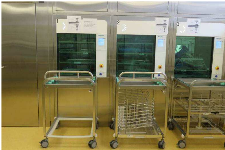
Abbildung: Zentralsterilisation Spitalverbund AR, Herisau

Die Empfehlung bezieht sich auf mengen- und abwasserrelevante Anwendungen von Desinfektionsmitteln im Gesundheitsbereich (Spitäler, Kliniken, Arztpraxen, Pflegeheime etc.) sowie in Lebensmittel verarbeitenden Betrieben (Milch, Fleisch, Getränke etc.). Sie dient den Betrieben als Hilfsmittel für den Ersatz von potentiellen Problemstoffen, ersetzt jedoch die detaillierte Risikobeurteilung im Einzelfall nicht. Nutzerabhängige Dosierung, Wirkung von Stoffmischungen, Eliminationsleistung der betroffenen Kläranlage und Regenwasserentlastungen sind beispielsweise nicht mitberücksichtigt. Gesundheitsgefahren (z.B. krebserregende, giftige oder ätzende Wirkungen) sowie physikalische Gefahren (Explosion, Korrosion, Entzündlichkeit) sind ebenfalls nicht Gegenstand dieser Beurteilung.