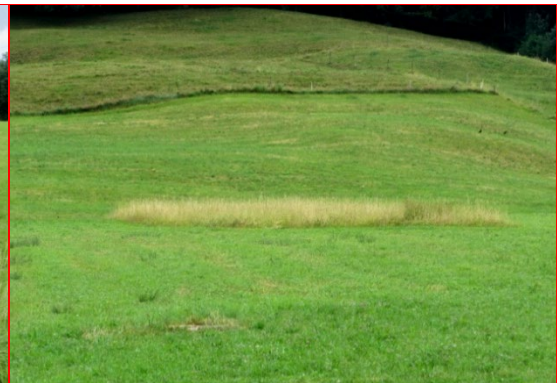
Zu wenig Fläche