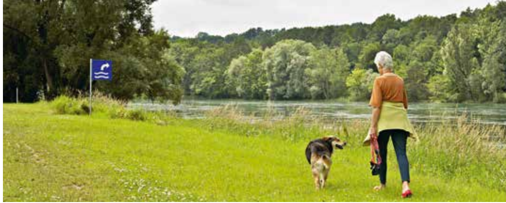
[a] Erholungszone am Rhein