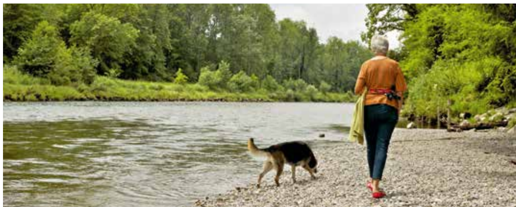
[c] Erholungszone Eggrank