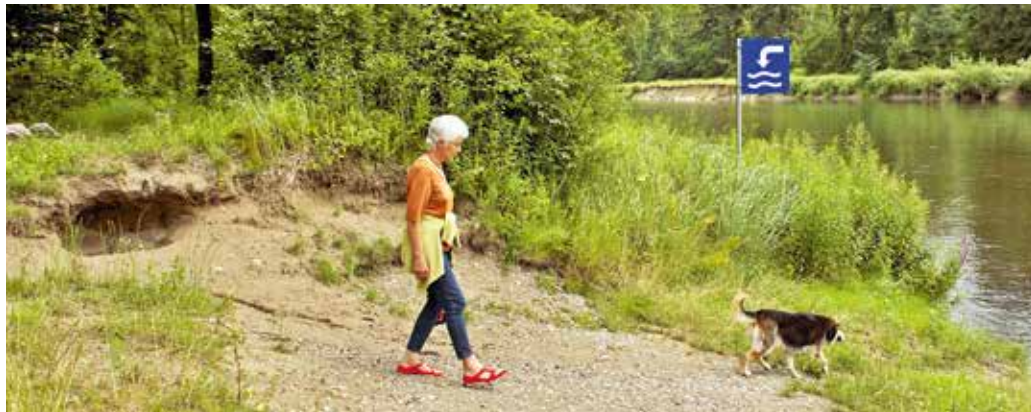
[b] Erholungszone Ellikerbrücke