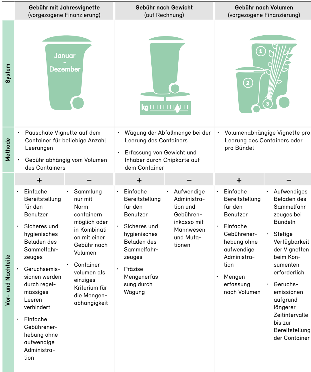
Tabelle 4 Bewährte Entsorgungssysteme für Grünabfälle (Grüngut)