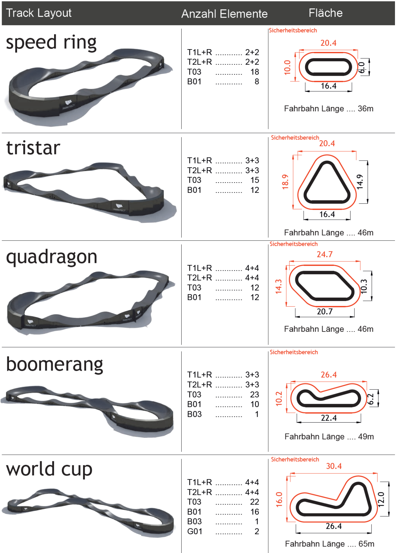
Abbildung 1: Aufbauvarianten Mobiler Pumptrack